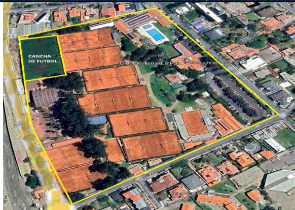
Club de Tenis Sede La Florida

Para ser llenado por el proponente al momento de elaborar su propuesta