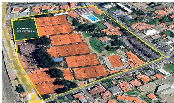
Club de Tenis Sede La Florida

En la imagen se puede ver claramente los lugares o áreas verdes (Jardines, árboles, arbustos, césped, flores, plantas) y cancha de fútbol donde se realizará el servicio de mantenimiento.